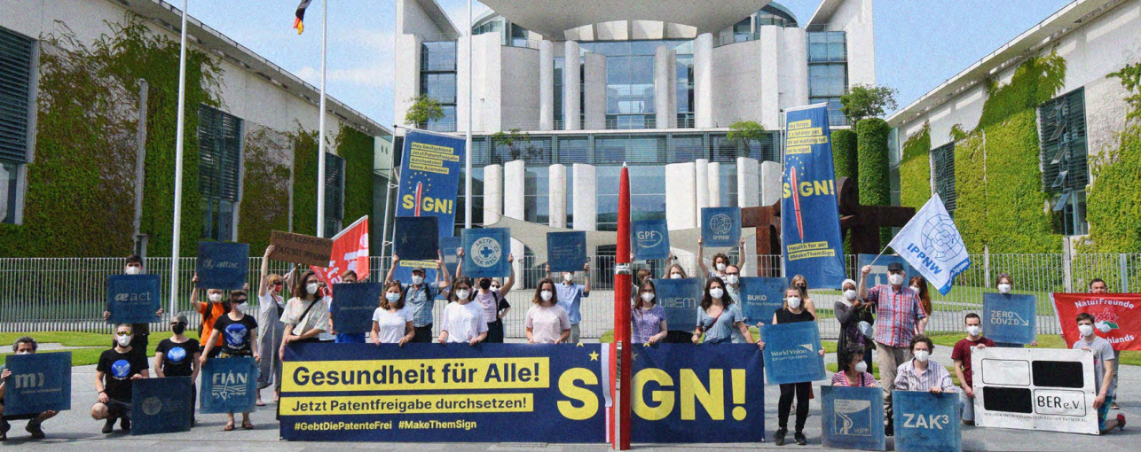
„Gesundheit für Alle! Make them Sign“-Kampagne zur Patentfreigabe von breitem zivilgesellschaftlichen Bündnis 2021 in Berlin.

Herstellungsgeheimnis und verhindern so einen Technologietransfer. Dabei sind es abgesehen von Suffizienz und Recycling auch Technologien, zum Beispiel im Bereich erneuerbare Energien, die wir für eine sozialökologische Transformation oder hinsichtlich des Zugangs zu den neuesten Verhütungsmitteln mit weniger Nebenwirkungen als ein Baustein zu reproduktiver Gerechtigkeit, die wir für ein gutes Leben für alle brauchen. Unbestritten sollte auch sein, dass Medikamente allgemein zugänglich, das heißt in ausreichender Menge vorhanden und bezahlbar sein sollten. Die globale COVID-19-Pandemie hat unwiderruflich illustriert, wie Patente Ländern des Globalen Südens den Zugang zu lebenserhaltenden Technologien, Medikamenten und Impfungen verstellt haben, während der Globale Norden, in dritter Position Deutschland, diese geradezu hortete (Ärzte ohne Grenzen 2021). Deutschland spielte zusätzlich eine unrühmliche Rolle und setzte sich trotz dringlicher Appelle der Zivilgesellschaft nicht in der EU dafür ein, dass Patente auf COVID-Impfungen und Medikamente zumindest zu Krisenzeiten ausgesetzt werden (medico international 2021).