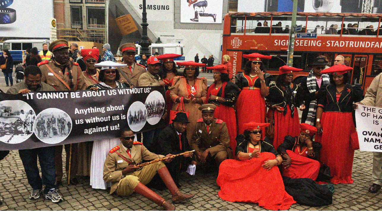
Protest von Vertreter*innen der Ovaherero und Nama in Berlin, 2016.