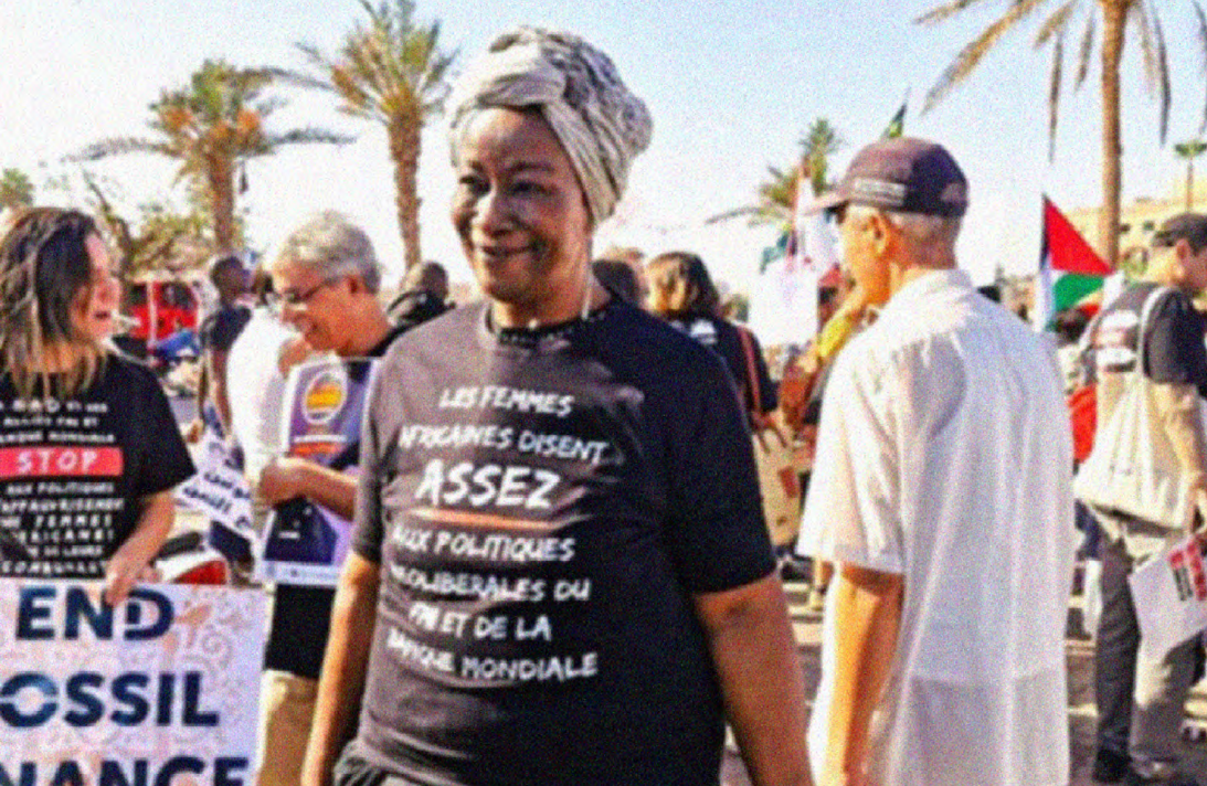
Aminata Traoré, ehemalige Ministerin Malis und Anti-Neoliberalisierungsaktivistin auf dem IWF/Weltbank-Gegengipfel in Marrakesch, Oktober 2023. Auf ihrem T-Shirt steht: „Die afrikanischen Frauen sagen ‚Genug! Es reicht!‘ zur neoliberalen Politik von IWF und Weltbank.“

in Abhängigkeit von privaten Krediten, Investitionen und Kapitalmarktmechanismen finanziert, was die Kontrolle der Empfängerländer zusätzlich einschränkt sowie das Schuldenrisiko erhöht (Banse u. a. 2021).